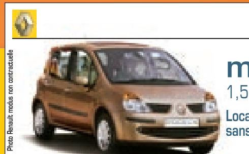
Photo Renault-modus non contractuelle

Bourges > Valenciennes Samedi 19 novembre à 20 heures