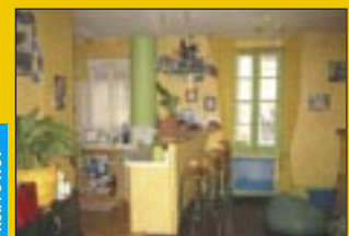
Ref. : 0410T

Maison ancienne édifiée sur cave, composée d'une entrée, cuisine, séjour-salon, une chambre, dressing, wc. A l'étage : 4 chambres, dressing, sdb, wc. Grenier au dessus. Cour Prix : hono négo inclus 279 440 €