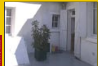
Ref. : 0452BL